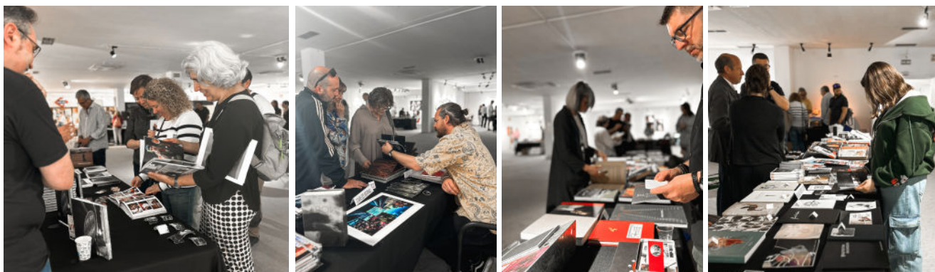
Algunas imágenes de la 3ª ed. 2023

ABEL ANAYA, AGRUPACIÓN FOTOGRÁFICA GUADALAJARA (AF/GU), AFSSR (AGRUPACIÓN FOTOGRÁFICA SAN SEBASTIÁN DE LOS REYES), ALEX RIVERA, ALFONSO GRAU, ANDREA M. FIGUEIREDO, AULA DE FOTOGRAFÍA DE LA FGUA, BELÉN SERRANO, BELÉN TRILLO, BLUME EDITORIAL, CALMA Y SOSIEGO EDICIONES, CAPTION MAGAZINE, CARLOS ESCUDERO, CAROLINA PAZ ZÚÑIGA Y LAURA VILELA, CARRATALÁ, COLECCIÓN DE FOTOLIBROS (BIBLIOTECA FAC BA), DPTO. DE DISEÑO E IMAGEN FACULTAD DE BELLAS ARTES UCM, EDUARDO CIMADEVILA, EXIT, EXPOFOTO MADRID, GRÁVALOS APLICACIONES GRÁFICAS - OTRO MATIZ EDICIONES, HEADS TAKE AWAY, INCREÍBLES LIBROS MENGUANTES, INMA ZOILO, IRE LENES, ISABEL QUESADA, JAVIER ARCENILLAS, JOSÉ GRESA, JULIO BALAGUER, LA FÁBRICA, LEIRE IZAGUIRRE MONTALVO, LUIS MENDÍA, LUIS VIOQUE, MANUEL JESÚS PINEDA, MAR LEÓN, MARÍA ANTONIA GARCÍA DE LA VEGA, MARÍA CAMPOS, MARÍA DAIN, MIGUEL DAVID, MIQUEL FERRER, MORENO&SORIA, NICOLÁS EZEQUIEL FIORENTINO, PABLO ESTRADA FERNÁNDEZ Y AMIR ARSALAN, PIC.A, RAY SOLANS, ROCÍO BUENO ROYO, RUTH PECHE, SARA ZULUAGA, TALLER "FOTOGRAFADO PARA FOTÓGRAFOS" DE LA UPMD, TERESA GARCÍA-MURO, TONI JEREZ, UNDEREXPOSE, UNIV. REY JUAN CARLOS, VICTORIA TOFER, VIRGILIO HERNANDO VAÑÓ, WILSON GRANADA.